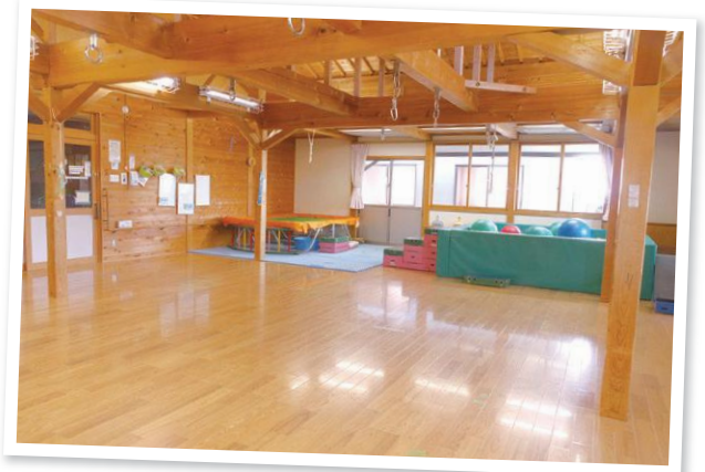
県より「障害児等療育支援事業」、南信州広域連合より「障害者(児)相談支援事業」を受託しています